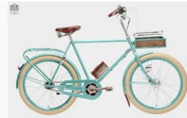
ELECHIC Copenhagen Balloon, Light Green

mrGadJet.it Your Professional Gift Partner