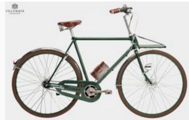
ELECHIC Arrow Classic, Racing Green