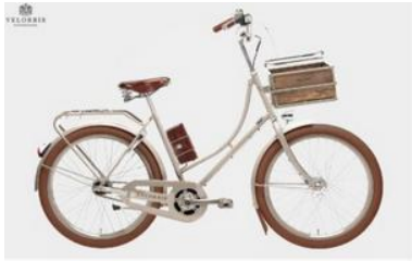
ELECHIC Copenhagen Balloon, Grey Beige