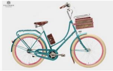
ELECHIC Copenhagen Balloon, Turquoise &